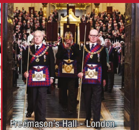
Freemason's Hall - London