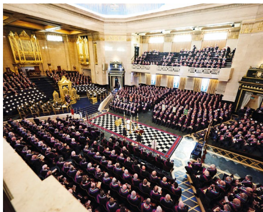
Freemason's Hall - London

Então, peça recomendações a um irmão de sua loja que seja Companheiro do Arco Real ou contate um dos Grandes Oficiais do Supremo Grande Capítulo do Arco Real do Estado de São Paulo. Ou apenas converse com qualquer um que esteja portando uma insígnia do Arco Real – ele terá prazer em ajudá-lo a completar sua jornada.